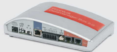
/Fronius Datamanager Box 2.0

/ Fronius Datamanager inverteri direkt olarak Fronius Solar.web'le bağlandığından dolayı açık ve kolay destek sunar.